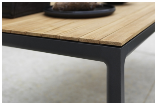
SOFT Gartentisch - mit fließend abgerundeten Kanten